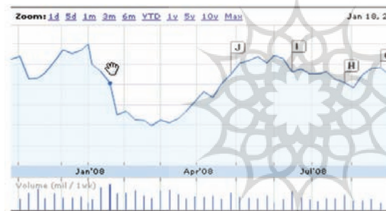
(۲۰۰۸، تغییرات نرخ سهام اپل : googleFinance)

همان طور که گفتیم عمده ترین عوامل رشد سهام اپل در مقطع های مختلف به دلیل عرضه