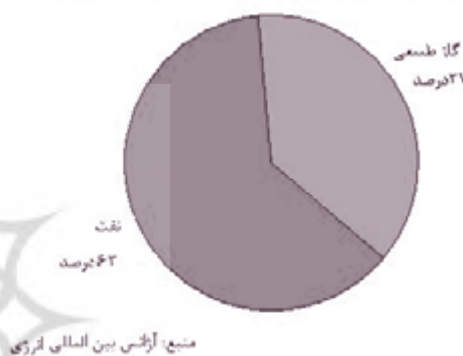
کل مصرف انرژی در عربستان سعودی بر اساس نوع

بر اساس تازه‌ترین آمار، عربستان سعودی پانزدهمین مصرف‌کننده انرژی است که بیش از ۶۰ درصد مصرف انرژی این کشور نفت محور و بقیه نیز شامل گاز طبیعی است که به علت محدودیت‌های موجود در زمینه انتقال، مصرف آن محدود مانده است.