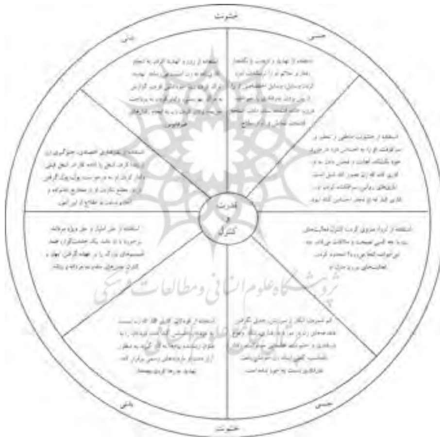
شکل ۲: چرخه کنترل و قدرت

و توسعه یافته، از جمله آمریکا وجود دارد، عامل برانگیزاننده خشونت علیه زنان محسوب می‌شود. مردان بدرفتار، مردانگی را با توانایی کنترل و غلبه بر همسر مرتبط می‌دانند. از طرف دیگر، بیشتر زنان کتک خورده، اعلام می‌کنند که ایجاد محدودیت بخش مهمی از اعمال خشونت علیه آنهاست. به این ترتیب، می‌توان الگویی از چرخه قدرت و کنترل یا ایجاد محدودیت ارائه داد که خشونت علیه همسر را تبیین می‌کند. این چرخه که در شکل (۲) نشان داده شده، توسط محققان پروژه مداخله در بدرفتاری خانگی در دالاس مینه سوتا ابداع شده است. البته نمی‌توان این چرخه را در مورد همه فرهنگ‌ها به کار برد (کرافورد، ۲۰۰۴ ۱ ، ۴۶۷-۴۶۹).