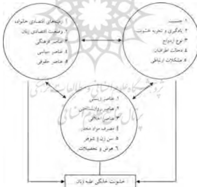
شکل ۳: الگوی ترکیبی تبیین خشونت «فردی، تبادلی، اجتماعی»

الگوی ما از تبیین خشونت به سه جنبه فردی، تبادلی و اجتماعی - اقتصادی باز می‌گردد. هر چند دو عامل تبادلی و اجتماعی - اقتصادی غالباً به واسطه عوامل فردی بر پدیده خشونت تأثیرگذار است؛ ولی در برخی موارد، تأثیر مستقیم آنها بر خشونت روشن است. در شکل (۳) عوامل مؤثر بر خشونت علیه زنان را در ضمن سه عامل اصلی نشان داده شده است.