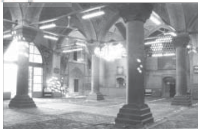
مسجد حاجی محمد صادق(آباده ای)، اصفهان

این روش، بویژه قسم اول آن را می توان تنها روشی دانست که معصومان(ع) از آن در آموزشهای علمی بهره می گرفتند. در این قسم فعالیت اصلی آموزشی متوجه دانش آموز است و اوست که باید به مطالعه و کاوش پردازد و به مسائل و موضوعات نو