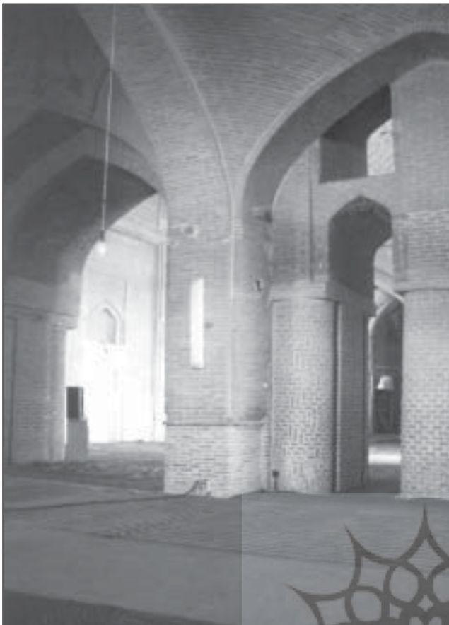
مسجد جامع گلپایگان

در مورد چیزهایی از تو سؤال کنم. امام فرمود: «سل تفقها و لاتسأل تعنتاً» (برای فهمیدن پرس نه برای عیب جوئی) [عروسی حویزی، تفسیر نورالثقلین، ج ۱، ۴۷].