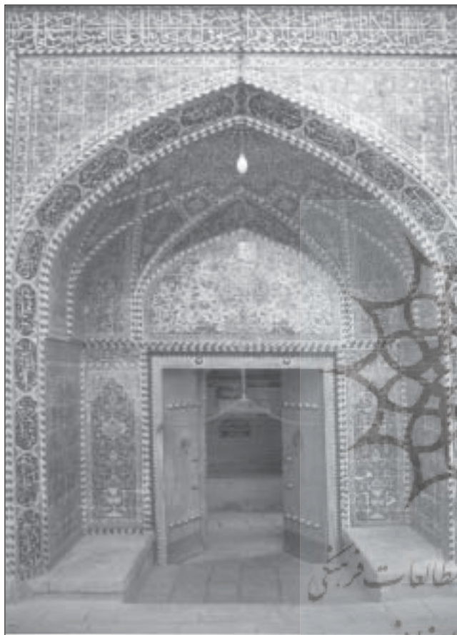
مسجد بزرگ الملک، اصفهان

۳. در این قسم، سؤال گاه از امام(ع) است و گاه از شاگرد، ولی سؤالات به صورت پیوسته و در راستای پاسخها طرح می شود.