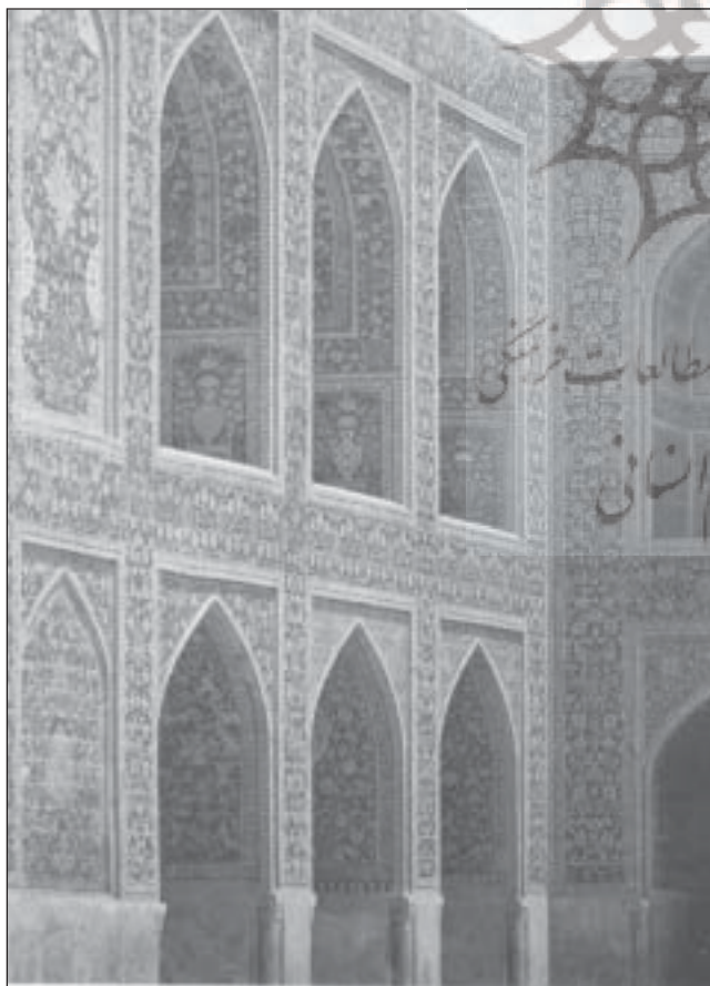
مسجد امام خمینی، اصفهان