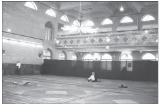
مسجد خداداد، تهران

۱. گاهی برای اینکه مطلبی را به دیگری بگویند از او می پرسیدند: آیا فلان مطلب را به تو بگویم؟ پس از اینکه از این طریق توجه مخاطب را به خود جلب می کردند و یا نیاز او را به یادگیری بر می انگیزتند مطلب را برای او بیان می کردند. امام باقر(ع) به کسانی که در محضر او بودند فرمود: «آیا شما را به کاری آگاه سازم که هرگاه انجام دهید شر شیطان و سلطان را از