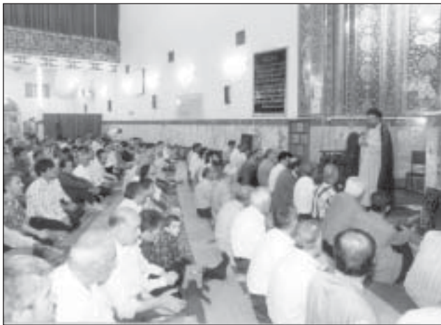
مسجد النبوی (ص)، میدان نبوت، تهران

واقعی برساند و درصدد تفهیم جهل او نیست [شعبانی، مهارت‌های آموزشی و پرورشی، ۱۳۰۹]. همچنین طرفین بحث در روش سقراطی لزوماً معلم و شاگرد نیستند، برخلاف روش پرسش و پاسخ که طرفین معلم و شاگردند.