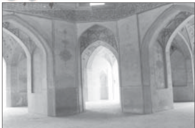
مسجد و مدرسه آقا بزرگ، کاشان

اهمیت تعلیم و تعلم در اسلام انکار ناپذیر است. در اهمیت دانش اندوزی در اسلام همین بس که قرآن کریم آن را مفروض و جدانشناخته می‌داند و می‌پرسد: «قل هل یتسوی الذین یعلمون و الذین لا یعلمون» [زمر/۹] (بگو آیا کسانی که می‌دانند با کسانی که نمی‌دانند یکسانند). همچنین قرآن کریم عالمان را بر غیر عالمان برتری داده، می‌فرماید: «یرفع الله الذین آمنوا منکم و الذین اتوا العلم درجات» [مجادله/۱۱] (خداوند کسانی را از شما که ایمان آورده‌اند و کسانی را که علم به آنان داده شده درجات عظیمی می‌بخشد). پیامبر اکرم(ص) علم را سرچشمه همه کارهای نیک و نادانی را منشأ تمام کارهای شر دانسته است. علی(ع) نیز آن دو را اصل همه کارهای نیک و بد می‌داند [محمدی ری شهری، میزان الحکمة، ج ۶، ۴۵۱]. درباره اهمیت و جایگاه دانش اندوزی در اسلام سخن فراوان است، اما از آنجا که محور بحث ما در آموزش و تعلیم است، از پرداختن بیشتر به اهمیت علم خودداری کرده، به اهمیت آموزش می‌پردازیم. گرچه اهمیت علم در اسلام گویای اهمیت آموزش نیز هست، زیرا علم، تعلیم و تعلم از هم جدا شدنی نیستند و هر سه به هم گره خورده‌اند.