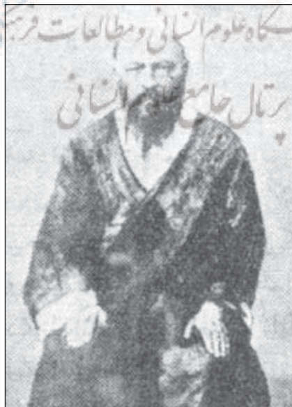
آیت الله میرزا محمد ارباب قمی از شاگردان ایشان