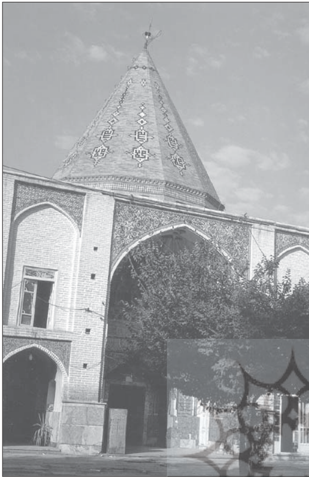
امامزاده علی بن جعفر، قم