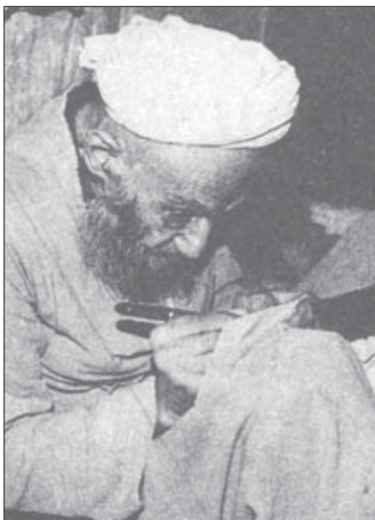
آیت الله شیخ آقا بزرگ تهرانی صاحب الذریعة

شیخ آقا بزرگ تهرانی درباره آیت الله نادی قمی تأکید می کند: «از مخلصین و شیفتگان و دلدادگان ائمه اطهار - علیهم السلام - بود، و در مصایب ایشان با صدای بلند گریه می کرد و از خود بیخود می شد» [تهرانی، نقباء البشر، ۳۷۶].