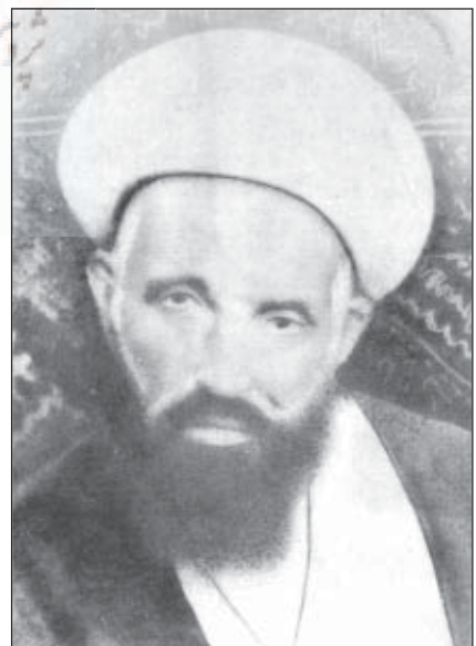
آیت الله شیخ ابوالقاسم کبیری قمی از شاگردان ایشان