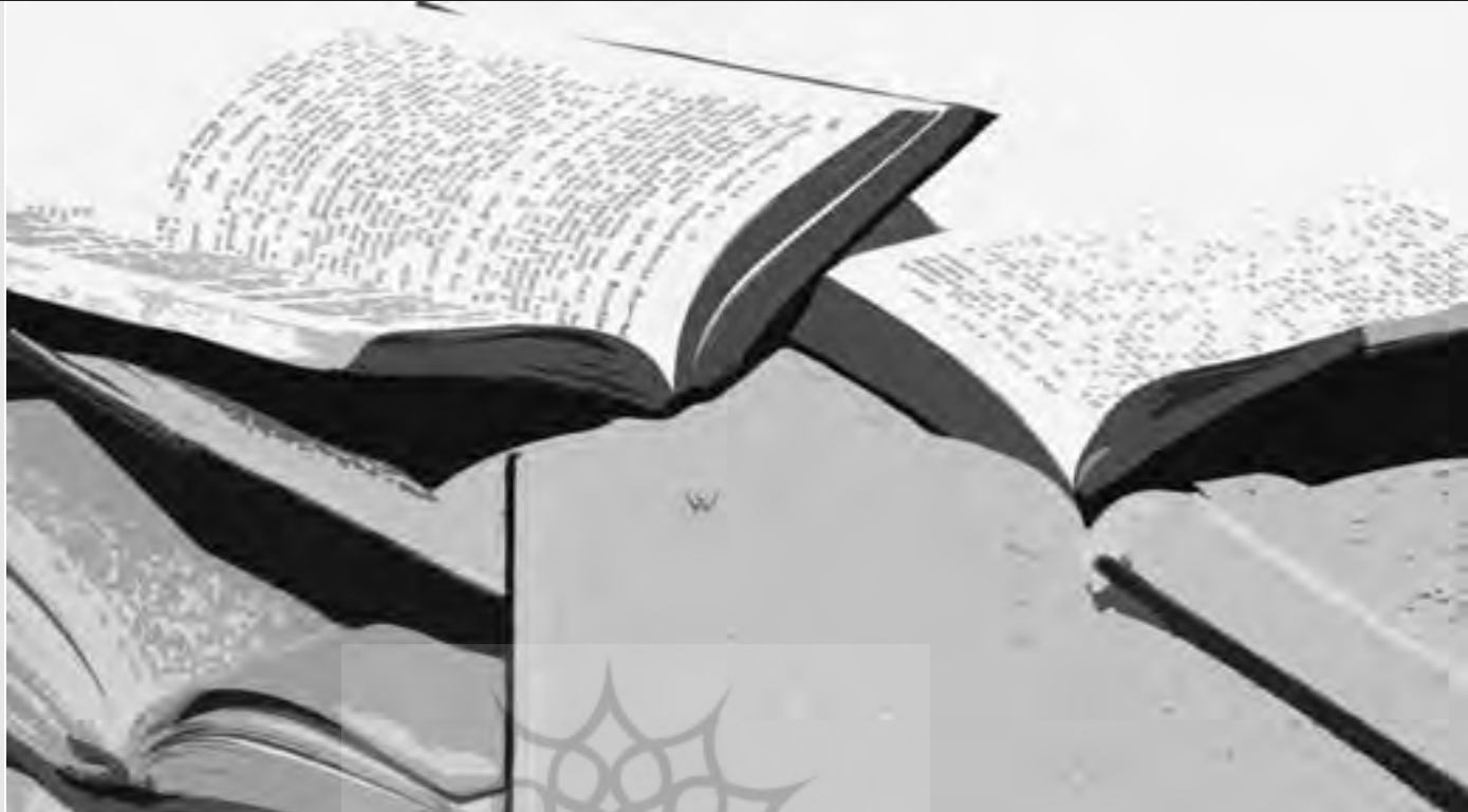
جدول شماره ۸ پاسخگویی کتابداران به اعضای هیئت علمی