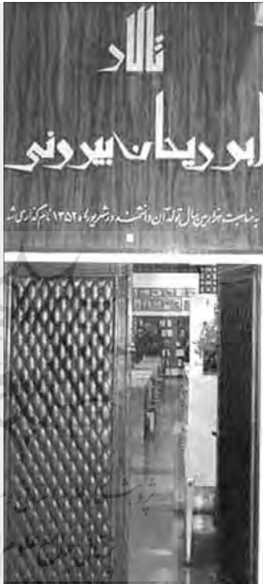
تالار مرجع (ایوریحان بیرونی)

اهدای کتاب به مراکز و موسسات آموزشی، پژوهشی و دانشگاهها با اولویت مراکز آموزش عالی دولتی و سایر مراکز