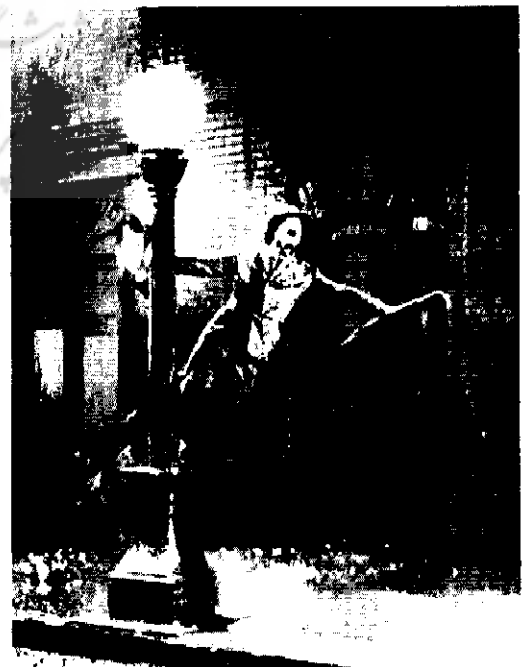
آواز در باران ساخته‌ی جین کلی

تاکنون فیلم‌های کمدی موفق و پرطرفداری در سینمای ایران ساخته شده‌اند که از آن میان می‌توان به فیلم‌های «اجاره‌نشین‌ها»، «مرد عوضی»، «ای ایران» و «مومیایی ۱۳» اشاره کرد.