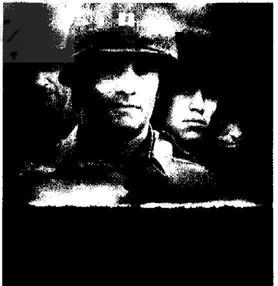
نجات سرباز وظیفه رایان ساخته‌ی استیون اسپیلبرگ

پرداخته می‌شود. تأکید بر اثرات مخرب و زبان‌آور جنگ در این فیلم‌ها باعث به وجود آمدن «تم ضد جنگ» در اکثر این فیلم‌ها شده است و به نوعی تمامی این فیلم‌ها در نكوهش جنگ هستند. وقایع و رویدادهای تاریخی،