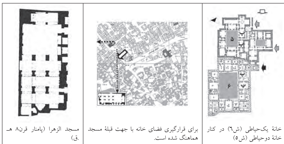
مسجد الزهرا (پامناز قرن ۸ هـ ق.)