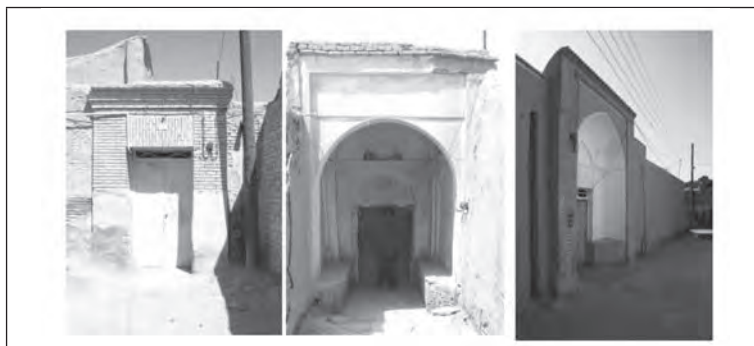
جدول ۱. تطبیق خانه‌های محلات مسلمان‌نشین، زرتشتی‌نشین و یهودی‌نشین کرمان

تصویر ۱. از راست، ۱. سردر خانه ش ۷ در محله زیرسیف؛ ۲. سردر خانه ش ۶ در محله شهر؛ ۳. سردر خانه‌ای در محله (دولت‌آباد) یهودیان.