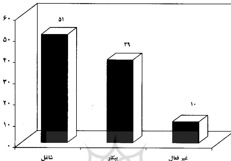
نمودار ۲. توزیع پاسخگویان (بیکاران جویای کار) استان یزد از نظر فعالیت

اگر تعداد بیکاران جویای کار ثبت‌نام شده را فقط معادل ۵۰ درصد کل بیکاران جویای کار استان بدانیم و بر اساس نتایج به دست آمده از این تحقیق، فقط ۳۹ درصد آنان را به عنوان بیکار واقعی جویای کار در نظر بگیریم آنگاه نرخ بیکاری استان با توجه به جمعیت فعال آن در سالهای ۱۳۸۲ (۳۱۴۴۱۳ نفر در کل استان) و ۱۳۸۳ به مراتب کمتر از ارقام رسمی منتشر شده خواهد بود. بر این اساس نرخ بیکاری استان در سال ۱۳۸۲ معادل ۱۲/۱ درصد به دست می‌آید (جدول شماره ۱). همچنین نرخ بیکاری در سال ۱۳۸۳ که جمعیت فعال استان به ۳۵۸۵۳۷ نفر و تعداد بیکاران جویای کار ثبت‌نام شده به ۶۰۸۶۰ رسیده است معادل ۱۳/۲ درصد خواهد بود (جدول شماره ۲).