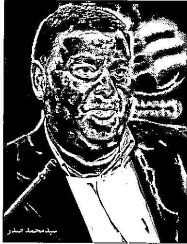
سید محمد صدر