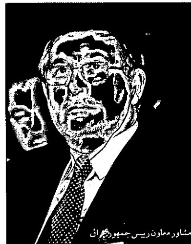
مشاور معاون رئیس جمهور ایران

راستای منافع متعدد اعضای آن نهاد دانست و بر انجام تلاش فراوان در اتحادیه برای گسترش رابطه با ایران تاکید کرد. وی همچنین موافقت خود را با نظر ابراز شده در کنفرانس مبنی بر اینکه موضوع هسته‌ای از یک موضوع فنی به یک موضوع سیاسی تبدیل شده اعلام کرد و با اشاره به نگرانی اروپاییان از جمله انگلیس از تجزیه عراق و افغانستان گفت: «اروپا با تاخیر، اهمیت ایران و نقش آن بر آینده عراق، افغانستان و منطقه را درک کرده است.»