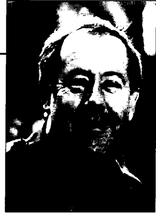
گروه مترجمان میناق مدیران info@MisaqModiran.com

ریچارد تانر پاسکال ۱ در اوایل دهه ۱۹۸۰ معروف شد یعنی زمانی که کتاب معروف پیترز و واترمن ۲ به نام در جستجوی عالی بودن در سال ۱۹۸۲ منتشر شد و هدف آن بازتعریف مسیر موفقیت سازمانی بود. کتاب او به نام هنر مدیریت ژاپنی (که آن را همراه با آنتونی آتوس ۳ به رشته تحریر درآورده) نمادی از مدل هفت اس ۴ مککنزی ۵ است که به یک مدل کلاسیک تبدیل شده و باعث شده که او به یکی از پیشگامان تفکر مدیریت در تمامی اعصار تبدیل شود.