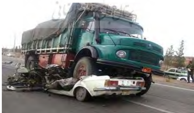
شکل یک- نمونه‌ای از تصادفات رانندگی در ایران

خواب‌آلودگی راننده، کابوسی است که همواره بر روح و جان مسافران سایه انداخته است. متأسفانه این کابوس در جاده‌های کشورمان در اکثر موارد به واقعیت پیوسته و همواره در سطح جاده‌های کشور شاهد از بین رفتن هموطنان عزیزمان هستیم. متأسفانه کشور ایران در بحث تلفات جاده‌ای در جهان رتبه نخست را دارد و سالیانه حدود ۳۰ هزار نفر از عزیزانمان در این حوادث جان خود را از دست می‌دهند [۱]. گفتنی است این موضوع محدود به کشور ما نیست و در سرتاسر جهان معضل تصادفات جاده‌ای وجود دارد.