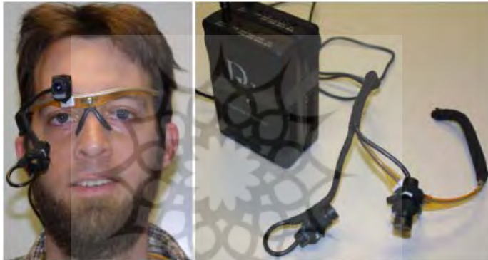
شکل ۳- عینک ابداعی برای تشخیص خواب‌آلودگی

رایان ۲ و همکارانش عینکی را ابداع کرده‌اند که بر روی آن دوربین کوچکی طراحی و نصب شده است که با آن چشم و مسیر دید فرد تشخیص داده می‌شود که نمونه‌ای از آن در شکل سه نمایش داده شده است [۳۴].