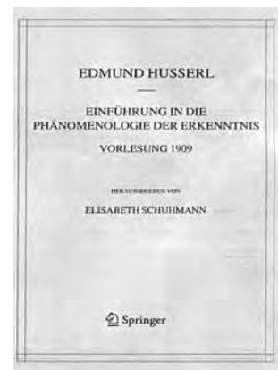
Husserl, Edmund. 2005. Einführung in die Phänomenologie der Erkenntnis; Vorlesung 1909 . Springer

هوسرل برای تنظیم این درس گفتار از بسیاری از درس گفتارهای قبلی اش استفاده نموده است و اگر چه می‌توان گفت که او برای ارائه درس گفتار سال ۱۹۰۹، دستنوشته درس گفتار درآمدی به منطق و نقد شناخت (ترم زمستان ۱۹۰۶/۰۷) را در اختیار داشته است، اما در درس گفتار ۱۹۰۹ مسیر جدیدی را طی می‌نماید و پدیده شناسی را به عنوان علم مربوط به آگاهی محض معرفی می‌کند: "علمی که در این درس گفتارها می‌خواهم به شما معرفی نمایم، علمی ماهیتاً جدید است. پدیده شناسی به قدری بکر و تازه است که افراد اندکی در زمان ما از وجود آن و حتی از امکان چنین علمی اطلاع دارند... تازگی پدیده شناسی بدین خاطر است که پژوهش‌های علمی از نوع پدیده شناختی مبتنی بر شناخت روشنی از مسائلی هستند که باید حل شوند، مسائلی که برای اعصار گذشته کاملاً بیگانه بوده‌اند." (ص ۵).