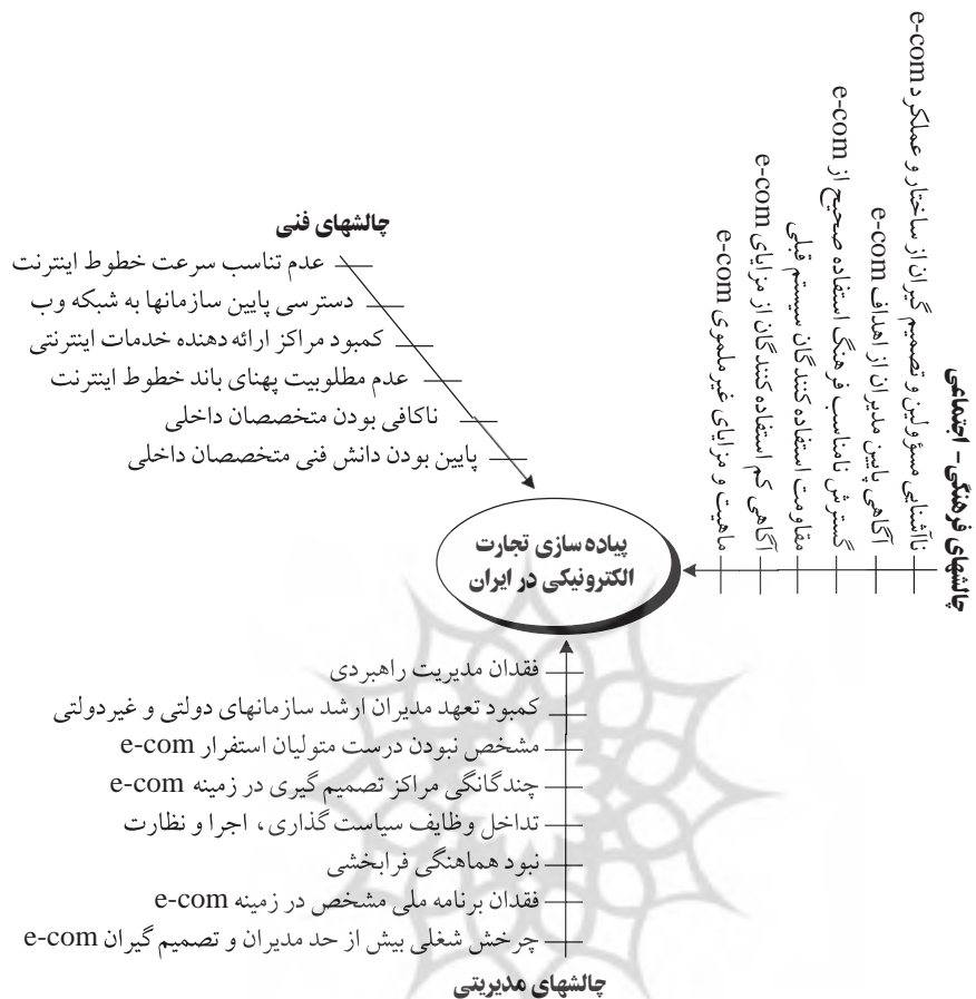
شکل (۱) مدل ابعادی (تفصیلی) تحقیق

روشها در دو طبقه کلی یکی روشهای کتابخانه ای (ابزارهایی همچون کتابها، مقالات و متون دیجیتال) و دیگری غیرکتابخانه ای (ابزارهایی مثل مصاحبه با خبرگان و توزیع و تحلیل پرسشنامه) جای می گیرند.