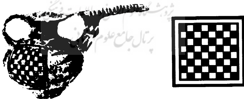
تصویر (۱) نماد مربع و آب در آثار سفالی باستان (نقش سفالی به دست آمده از تل بکون، مرودشت)

از جمله اشکال مربع که نماد زمین و خاک است و بر روی سفال‌ها باقی مانده است را می‌توان بر روی آثار سفالی به دست آمده از تل بکون مربوط به هزاره چهارم پیش از میلاد دید، که این تپه باستانی در مرودشت واقع در دو کیلومتری جنوب غربی تخت جمشید واقع است. نقوش روی ظروف اشکال مربع است که در داخل آنها نقش گیاه و خطوط موج (آب) دیده می‌شود. ۲۶ (تصاویر ۲-۳)