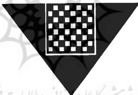
تصویر (۵) مثلث نماد خاک نقش شده بر روی سفال به دست آمده از شوش