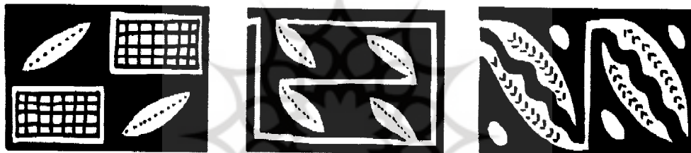
تصویر (۳) نقوش گیاهان در کنار نماد خاک بر روی ظروف سفالین به دست آمده از تل بکون (هزاره چهارم پ-م)