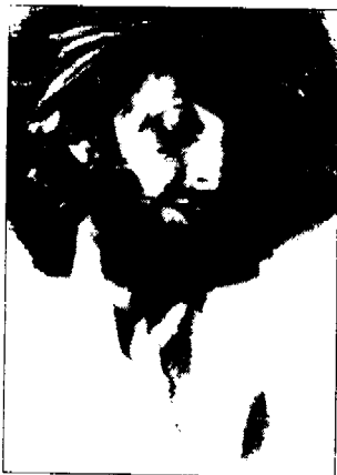
فرد هلندی: به یاد مسیح (ع) (عکاس خود را به صلیب کشیده و نقش مسیح (ع) را چونان یک روایت تاریخی از صلیب کشیدن مسیح (ع) تا دم آخر به نمایش درآورد) ۱۸۸۹