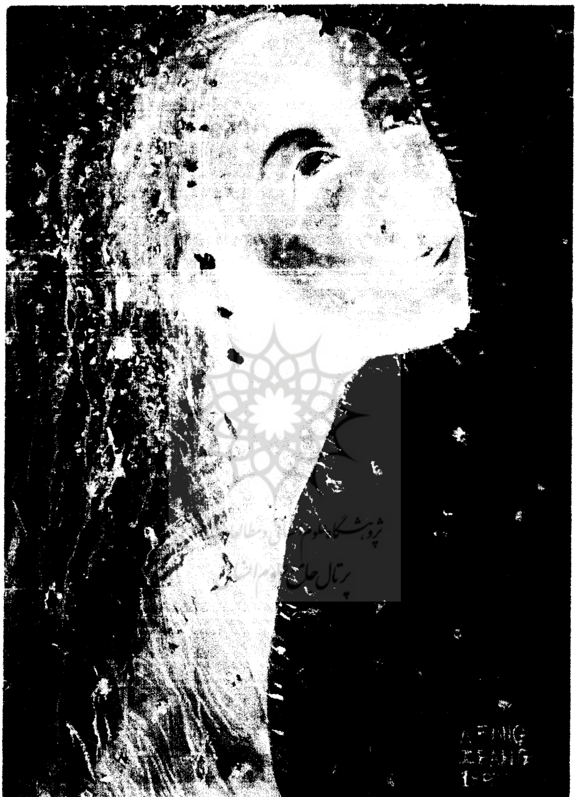
"Happy together-Portrait of a bride"