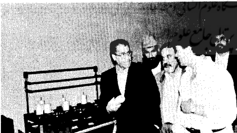
گوشنای از مراسم بازدید کارخانهای بافی زاهدان

ما هنوز در مورد جلب سرمایه‌های خارجی ابهام قانونی و برخورد‌های متضاد داریم هنوز در این راه - وحدت کلمه یا فتوایم که سرمایه‌های خارجی را قبول و تضمین کنیم یا آنرا مردود بشماریم. در حالیکه مثلاً در این مورد در سرا سر کشور مالزی یک سخن گفته میشود. این کشور جلب سرمایه‌های خارجی را بعنوان ابزار موثری برای رشد و توسعه اقتصادی شناخته است. تمام مراحل سرمایه‌گذاری خارجی - حتی بصورت مشترک - در این کشور در یک ساختمان انجام میشود و متقاضی مجبور نیست به سازمان دومی رجوع کند. تقریباً در همه کشورهای تازه توسعه یافته جنوب شرقی آسیا چنین تشکیلاتی وجود دارد و هر کس