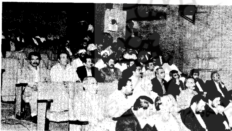
کمیته ای از شرکت کنندگان در سمینار سرمایه گذاری در منطقه آزاد تجاری و صنعتی چابهار.

برای یافتن سرمایه گذار علاوه بر اقدامات زیر بنایی باید به بازاریابی وسیع سرمایه دست بزنیم