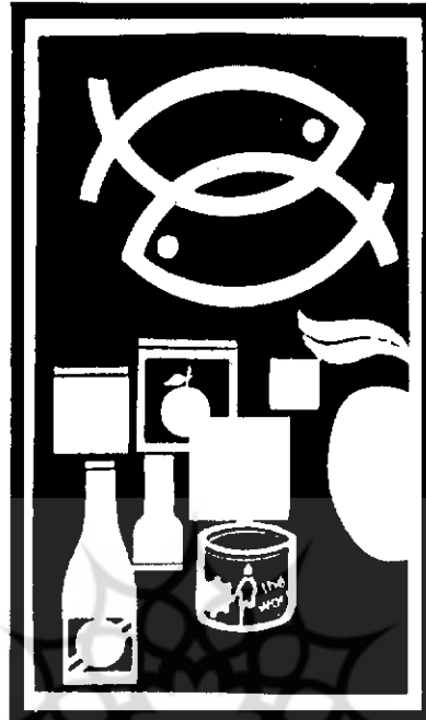
بازار فروش محصولات فله ایران از بین برود

این کار به رغم برخورداری از منافع کوتاه مدت ، در درازمدت به نفع صادرکنندگان نخواهد بود . لازم است بازارهای مذکور را هر چه سریع‌تر با روش‌های بسته‌بندی استاندارد در اختیار گرفت ، در غیراین صورت صدور کالای فله به این کشورها نمی‌تواند پی‌درپی ادامه یابد و به محض بهبود وضعیت اقتصادی آنها ، محصولات بسته‌بندی سایرین موجب می‌شود تا