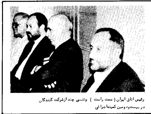
رئیس اتاق ایران (ست راست) و تنسی چند از شرکت کنندگان در بیست و دومین کمیته اجرائی

از هنگام برگزاری بیست و یکمین کمیته اجرائی در کشور اردن هاشمی و نیز از زمان برگزاری دهمین اجلاس عمومی در تهران، دنیای اسلام با تحولات بسیار روبه روبرو بوده که متأسفانه قسمت اعظم این تحولات جنبه منفی داشته است جنگها و کشمطراهایی که در کشورهای اسلامی و علیه مسلمانان و گاه بین مسلمانان و با دست خودشان ایجاد شده، شدت