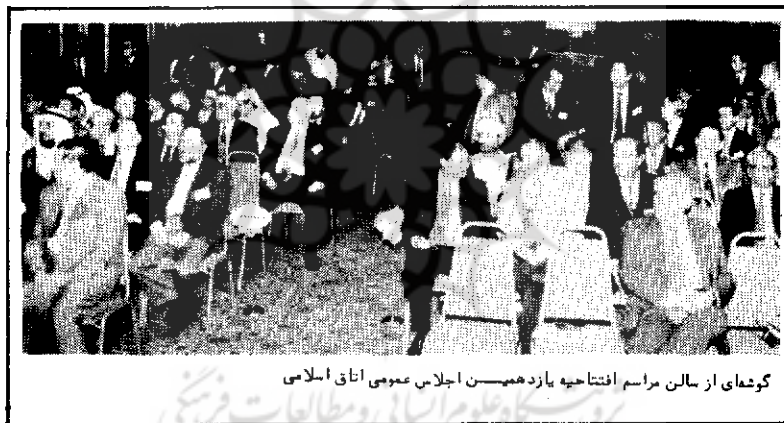
گوشه‌ای از سالن مراسم افتتاحیه یازدهمین اجلاس عمومی اتاق اسلامی

از چند سال پیش اتاق اسلامی به تشکیل یک مرکز داوری اسلامی توجه کرده بود. در اجلاسهای پاکستان و تهران در این زمینه مذاکرات مقدماتی و توافقاتی اصولی بعمل آمده بود. بر اساس