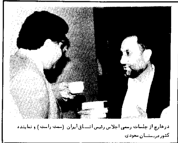
در خارج از جلسات رسمی اجلاس رهبران اسلام ایران (سمت راست) و نماینده کشور عربستان سعودی

وضع تأسف بار قیمت نفت را در سالهای اخیر و درست در حالیکه قیمت فراورد های کشورهای صنعتی رو به افزایش است، شاهد هستیم، مبادلات بین المللی به گونه ایست که کشورهای جهان سوم، و کشورهای مسلمان، دائماً "بیشتر متضرر میشوند.