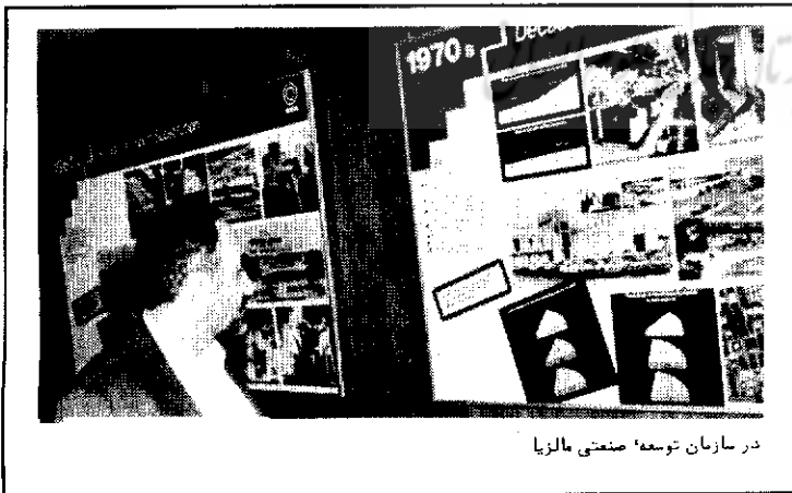
در سازمان توسعه صنعتی مالزی

برای من مایه خوشوقتی است که در بیست و دومین کمیته اجرائی و یازدهمین اجلاس عمومی اتاق اسلامی شرکت میکنم. از اتاق ملی بازرگانی و صنایع مالزی و یازدهمین اجلاس اتاق اسلامی که برای