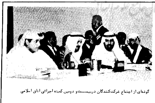
گوشه ای از اجتماع شرکت کنندگان در کمیته اجرایی اتاق اسلامی

در افغانستان شاهد تجدید برادر کشی ها هستیم.