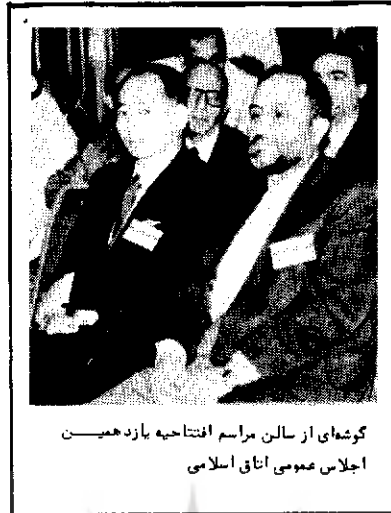
گوشه‌ای از سالن مراسم افتتاحیه یازدهمین اجلاس عمومی اتاق اسلامی

در روزهای نیکه یازدهمین مجمع عمومی اتاق اسلامی جلسات خود را برگزار می‌کند مذاکرات ۷ ساله معروف به دوراروگوشه پیرامون تجدید نظر