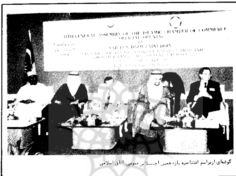
گوشه‌ای از مراسم افتتاحیه یازدهمین اجلاس عمومی اتاق اسلامی

رئیس اتاق ایران: در قبال آنچه بر دنیای اسلام می‌گذرد، کشورهای اسلامی وظیفه‌ای سنگین به عهده دارند