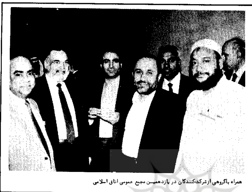
همراه با گروهی از شرکت‌کنندگان در یازدهمین مجمع عمومی اتاق اسلامی

در حالیکه اتحادیه گزاشی اینک بصورت یکروند جاری و روبه توسعه در اقتصاد جهان درآمده و در گوشه و کنار جهان دما و صدها اتحادیه اقتصادی در قالب منطقهای و گاه در قالب فرامنطقهای شکل گرفته یاد رجال شکل گرفتن است، کشورهای اسلامی سالهاست برای تشکیل یک بازار مشترک اسلامی تلاش میکنند. متأسفانه پیشرفت در این جهت به هیچ‌روی رضایت بخش نبوده است و عملاً "مذاکرات از یکسال به سال بعد منتقل شده است. امسال نیز مانند چند اجلاس قبلی، پیشنهاد شد کشورهای عضو اتاق اسلامی بعنوان نخستین گام برای تأسیس بازار مشترک اسلامی معادل ۲۰ درصد از تعرفه مبادلات بین خود را بکاهند. اگر این اقدام عملی شود، در نظراست بتدریج از تعرفه‌های مبادلات بین کشورهای عضو کاسته شود