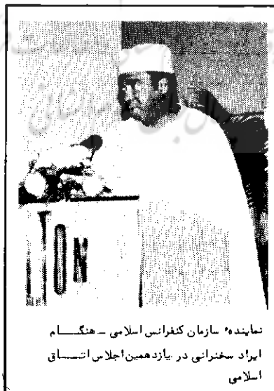
نماینده سازمان کنفرانس اسلامی - هنگام ایراد سخنرانی در یازدهمین اجلاس اتاق اسلامی

حجم داد و ستد بین کشورهای خاورمیانه به رقم ۳۲۷۸ میلیون دلار رسید که برابر ۱۵ درصد تجارت درون منطقه‌ای کشورهای اسلامی میباشد . حجم