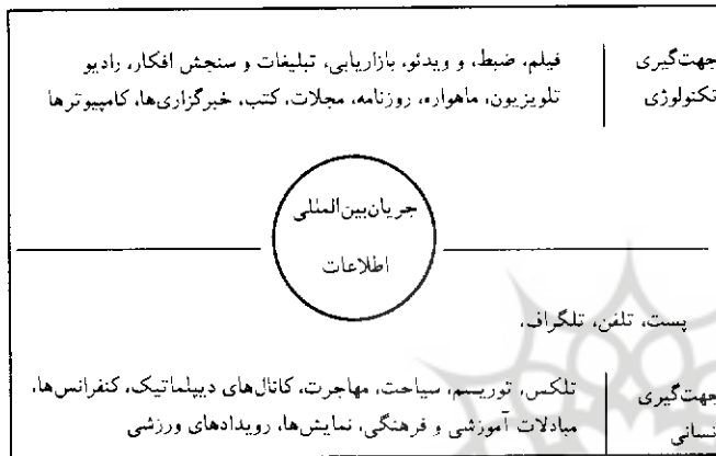
شکل ۲-۱: جریان بین‌المللی اطلاعات

آثار و کاربرد جریان بین‌المللی اطلاعات در زندگی انسان بر روی کره زمین فوق‌العاده با اهمیت و بسیار عمیق است. این بازتاب‌ها را می‌توان در حوزه‌های متعدد و متنوع همچون بانکداری و امور مالی، برنامه‌ریزی‌های مربوط به کشاورزی و ساختمان‌سازی، تجارت، آموزش، تفریح و سرگرمی، حکومت کردن، تعاملات گروهی، مراقبت‌های بهداشتی، خدمات خانگی، خدمات اطلاع‌رسانی، تعاملات بین افراد، مدیریت، نظامی‌گری، توسعه ملی، برنامه‌ریزی و قانونگذاری، اطلاعات عمومی، جامعه‌پذیری و... مورد بررسی قرار داد. ۱۹ به‌رحال بررسی بازتاب جریان بین‌المللی اطلاعات بر سیستم دولت - محور و اگر بپذیریم شکل‌گیری سیستم چند مرکزی در کنار حوزه‌های متعدد دیگر اهمیت شایان دارد. در اینجا ما تأثیر بعضی از ویژگی‌های تکنولوژی ارتباطاتی را بر سیستم دولت - محور مطرح می‌کنیم.