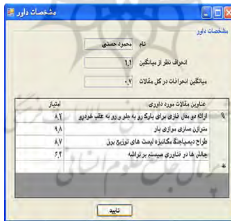
نمودار ۳. تخصیص داوران منتخب هیات تحریریه به مقاله

۱-۶. خلاصه ای از توانمندی های نرم افزار در پایان فاز اول: پس از آن که بخش Windows Application نرم افزار بر روی رایانه گرداننده نشریه راه اندازی گردید، دسترسی به گزارشات و استفاده از امکاناتی که ذیلاً به استحضار می رسد ممکن خواهد بود؛ نخست: لیستی از داوران که با کلیک روی نام هر داور، سابقه آن داور شامل عناوین و امتیاز مقالات مورد داوری او، انحراف نظر او از میانگین نظرات داوران در مقالاتی که در گذشته داوری نموده و میانگین انحرافات در کل مقالات مورد داوری نمایش داده می شود (نمودار ۳).