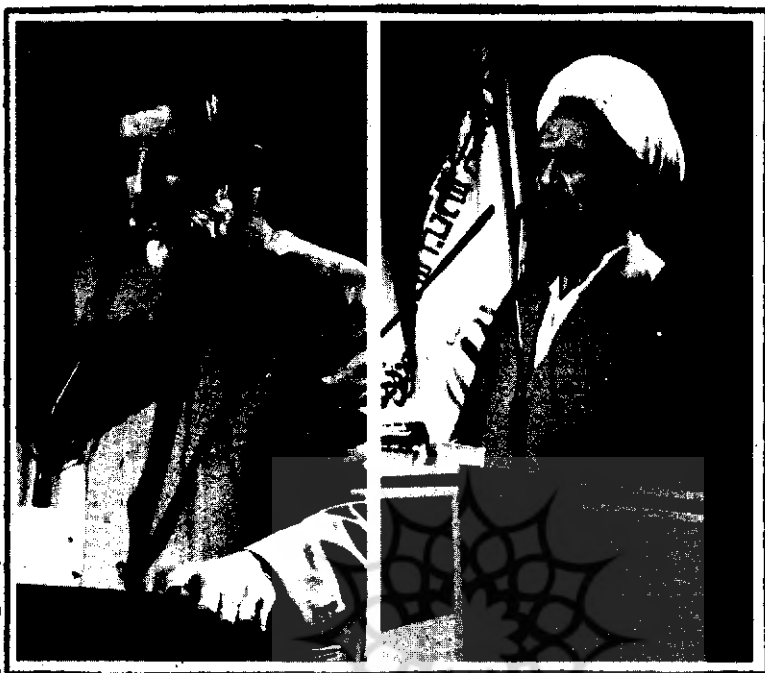
• دکتر غلامعلی حدادعادل