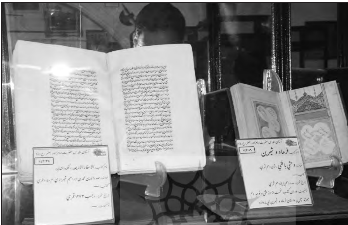
خاندان خلعتبری از جمله خاندان‌های با نفوذ و تأثیرگذار در مازندران به‌شمار می‌رود، که در طول تاریخ و به‌ویژه در اواخر قرن ۱۳ و اوایل قرن ۱۴ قمری در این منطقه بسیار تأثیرگذار بوده است

دیگر در انزوا به سر برده است. اما با این وجود در ساختن تاریخ صفحات شمالی کشور نقش داشته است. از نظر زمانی تأثیرگذاری این خاندان در تاریخ ایران از سلسله زندیه تا عصر پهلوی را شامل می‌شود.» (مقدمه)