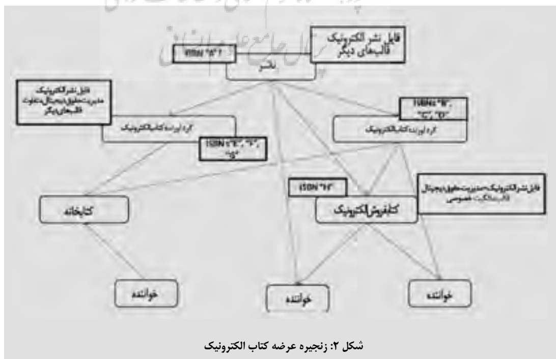
شکل ۲: زنجیره عرضه کتاب الکترونیک

مباحث مطرح شده نشان از ضرورت تولید راهنمای جدیدی برای نظام شایک است. راهنمایی که بر اساس نیازهای زنجیره عرضه و استفاده کنندگان طراحی شده باشد. یکی دیگر از مباحث بسیار مهمی که در این بخش مطرح شد شماره گذاری میلیون ها عنوان کتابی است که قبل از تاسیس نظام شایک (۱۹۷۰) تولید شده اند و فاقد شماره هستند. در خصوص نهادی که باید به شماره گذاری این آثار بپردازد، پیش شماره ها مربوط به این کتاب ها و شیوه های جلوگیری از تکرار به طور مفصل بحث شد. مباحث مشابهی در باره آثار الکترونیک فاقد شایک نیز مطرح شد.