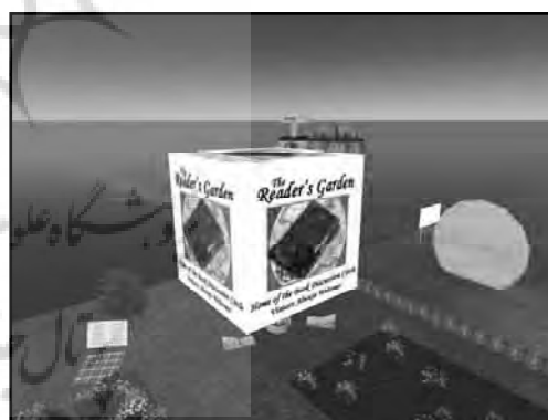
تصویر ۵. باغ مطالعه