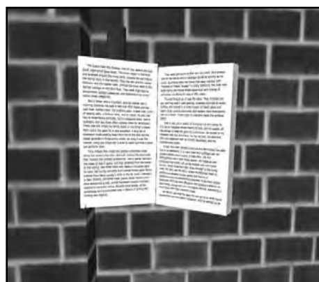
تصویر ۶ کتاب

در ماه‌های سپتامبر، اکتبر و نوامبر سال ۲۰۰۷ دوره‌های آشنایی با دوره‌های کتابداری دنیای مجازی ۱۴ در جزیره اطلاعات به مدت ۶ هفته برگزار خواهد شد. گروه‌های بحث کتابداران و کتابخانه‌ها هم در زد فعال هستند و با عضویت در گروه مورد علاقه، افراد می‌توانند از برنامه‌های گروه مطلع شوند و در بحث‌ها شرکت کنند. لازم به ذکر است که اعضای گروه‌ها، پیام‌ها را به وسیله پست الکترونیکی دریافت می‌نمایند، ولی برای ارسال پیام باید وارد زد شوند. برخی دانشکده‌ها و مدارس کتابداری دارای دفتر مجازی خود در