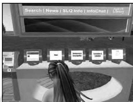
تصویر شماره ۴. رایانه‌های بخش جستجو

کتابداران مجازی باغ‌هایی ۱۱ (نگاه شود به تصویر ۵) جهت مطالعه و بحث برای مراجعان فراهم آورده‌اند و کتاب‌هایی وجود دارد که می‌توان به راحتی تورق کرد و مطالعه نمود (نگاه شود به تصویر ۶ و ۷).