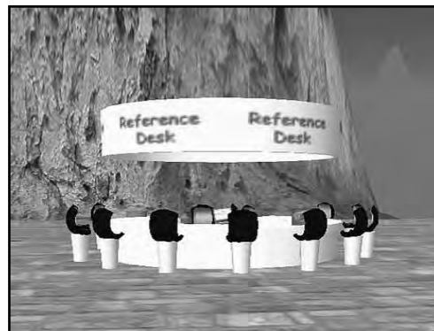
تصویر ۳. میز مرجع

بسیاری از کتابداران و متخصصان اطلاع‌رسانی با حضورشان در زد به تجربه زندگی دوم حرفه‌ای خود مشغول هستند. انجمن کتابداران آمریکا نیز به اهمیت موضوع پی برده است و حضور فعال کتابداران آمریکایی در زندگی دوم محسوس است و در زمینه برگزاری کلاس‌های آموزشی، میز مرجع (نگاه شود به تصویر ۳) و مجموعه‌سازی در زد وارد عمل شده است.