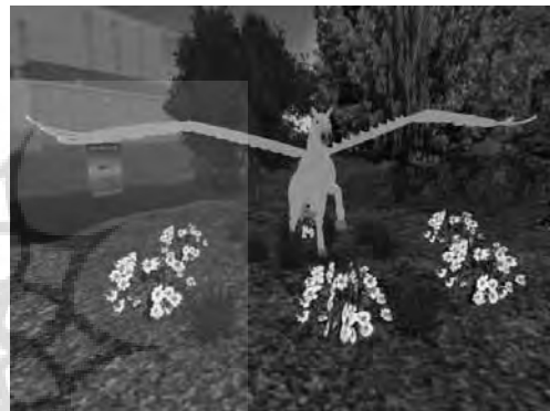
تصویر ۲. اسب بالدار

حق مؤلف نیز در این دنیا معتبر است و مخترعان و آفرینندگان آثار فکری می‌توانند در دنیای واقعی آنها را به نام خود به ثبت برسانند. تمامی نوآوری‌های کاربران شامل قانون حق مؤلف می‌باشد که مخترع و آفریننده‌های آنها با گزینه‌های هنگام ساخت آن می‌توانند اجازه استفاده و کپی برداری را ممنوع، محدود و یا منوط به پرداخت پول نمایند و همچنین می‌توانند انتقال آثار خود به دیگران را حتی پس از فروش، ممنوع یا مجاز کنند.