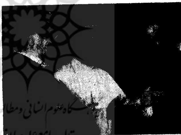
پاپ پل ششم در واتیکان از تیتو رئیس جمهوری یوگوسلاوی پذیرائی میکند