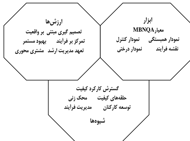
هیلستن و کلیفسجو، ۲۰۰۲، ص ۷

TQM، هنر مدیریت تمام مجموعه برای به دست آوردن بهترین‌هاست. روح کلام در توضیح TQM عبارت‌تلاپی زیر است: