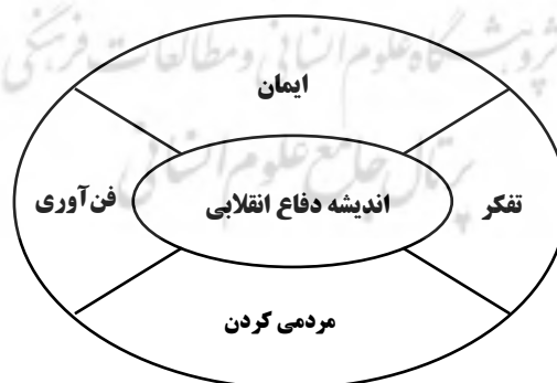
شکل 1: اصول اندیشه دفاع انقلابی

اندیشه چریکی که در جبهه‌ها آزمایش گردید و از پاسخ به مسائل اصلی جنگ ناکام ماند، عمدتاً بر محور ترجیح فکر و اندیشه بر فن آوری استوار بود و تجارب نبردهای چریکی قرن بیستم بدست آمده بود. برای برون رفت از مشکلات و معضلات مطرح شده اندیشه دفاع انقلابی تبیین گردید که بر پایه‌های اندیشه، ایمان، مردمی کردن دفاع و فن آوری استوار بود. اندیشه دفاع انقلابی معتقد بود که نتیجه نبرد در عرصه فکر و ایمان (یعنی باور) در بستر جامعه مشخص خواهد شد. در این دیدگاه فن آوری یک ابزار مفید برای کسب موفقیت است.