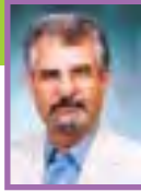
دکتر الف. کیهان‌نیا مشاور خوانندگان محترم می‌توانند جهت مشاوره، نامه‌های خود را به آدرس مجله ارسال نمایند.