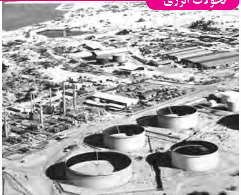
چشم‌انداز خصوصی سازی در صنعت نفت