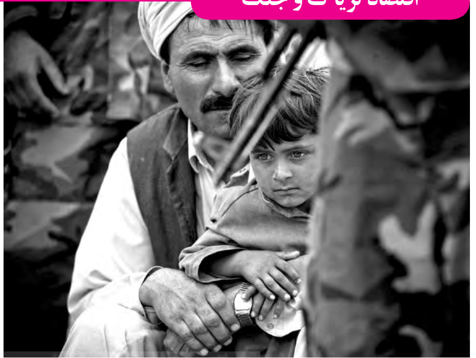
اقتصاد متلاطم افغانستان