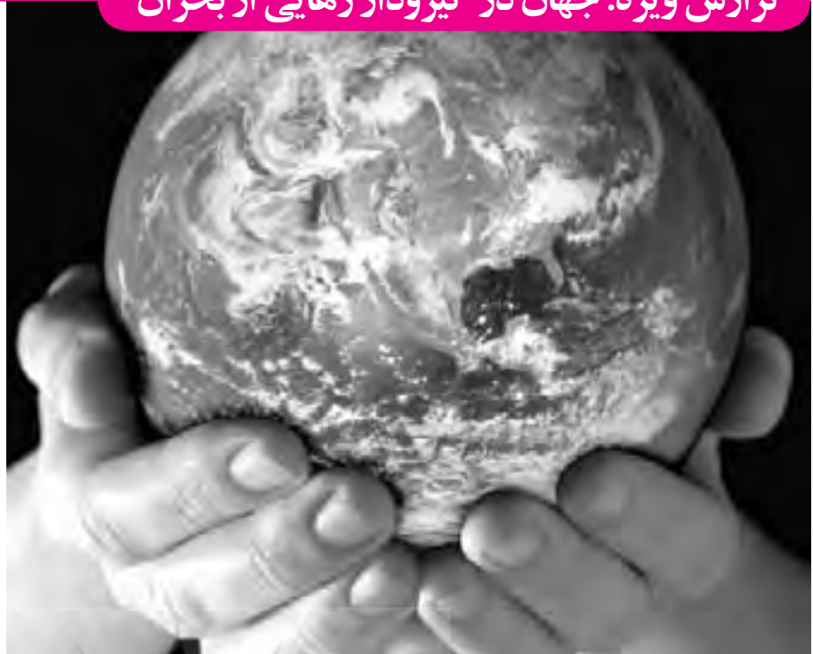
اقتصاد جهانی در بحران