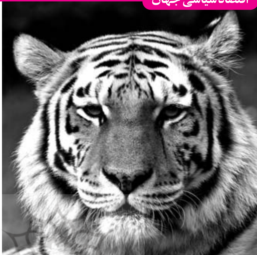
کشورهای جنوب شرقی آسیا