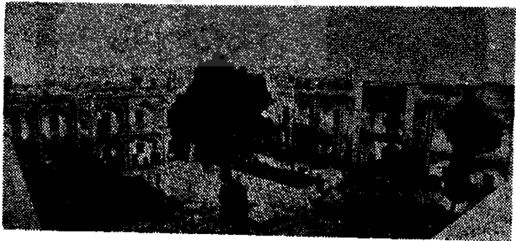
نمای داخلی مدرسه نواب

دیگر از ابنیه دوره صفوی ، مدرسه صالحیه مشهور به مدرسه نواب است ، که یکی از مدارس معمور و آباد مشهد مقدس بشمار میرود ، و از نظر موقوفات و درآمد درمیان مدارس قدیمه این شهر در درجه اول قرار گرفته ، و دارای کاشیکاری و خطوط نسبتاً نفیس و ظریفی هست .