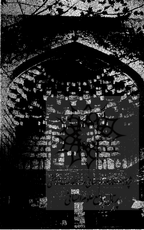
سرردی ورودی مدرسه نواب

بسم الله الرحمن الرحيم بعد حمد الله قداتفق اتمام بناء هذه المدرسة الرقيقة الصالحة في ايام خلافة السلطان الاعظم والخواقان الاكرم مولى ملوك العرب والمعجم السلطان بن السلطان ابن السلطان ابن السلطان والخواقان بن الخاقان بن الخاقان