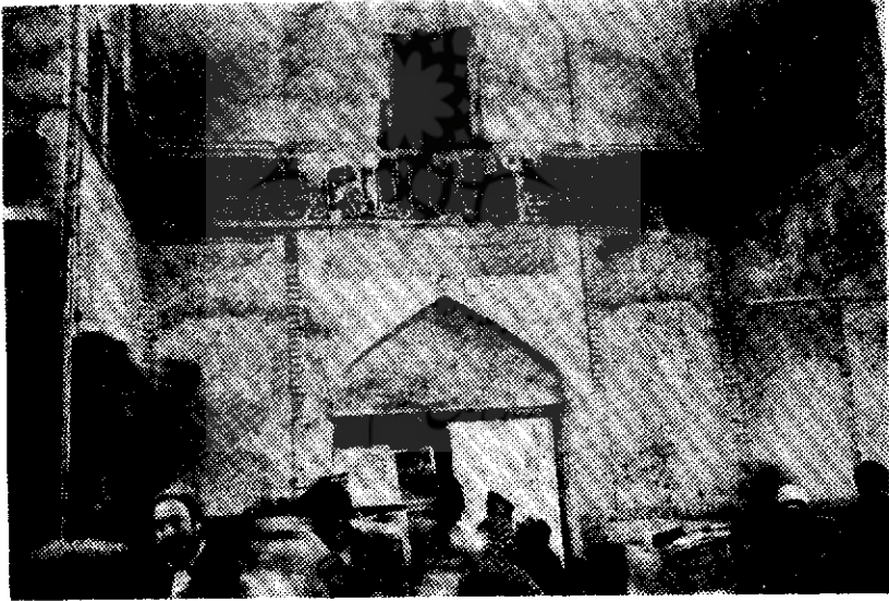
نمای سردر ورودی مدرسه دو در (یوسفیه)

دیگر از مدارس قدیمه شهرستان مشهد ! مدرسه دو در است که خود یکی از ابنیه تاریخی میباشد . (۱) این مدرسه در غرب بازار بزرگ مقابل