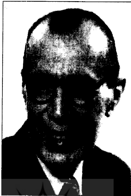
• محمدتقی بهار

«جمعیت ایرانی هواداران صلح» در ساعت ۱۰ صبح روز جمعه ۱۹ آبان ۱۳۲۹ شمسی اولین مجمع عمومی خود را در تهران در باغی که ملک الشعراء بهار در آن به سر می برد، تشکیل داد. هواداران صلح با حضور تقریباً همه اعضا در این مجمع گرد آمدند. اداره جلسه مجمع عمومی طبق اساسنامه با هیئت مدیره بود که عبارت بودند از آقایان ملک الشعراء بهار، حائری زاده، مهندس قاسمی، دکتر حکمت، محمد رشاد، احمد لنکرانی، دکتر سیدعلی شایگان، و محمود هرمز. اعضای مجمع عمومی در جای خود جلوس کردند و رسمیت جلسه را اعلام داشتند. (جناب آقای دکتر شایگان به علت مسافرت حضور نداشتند).