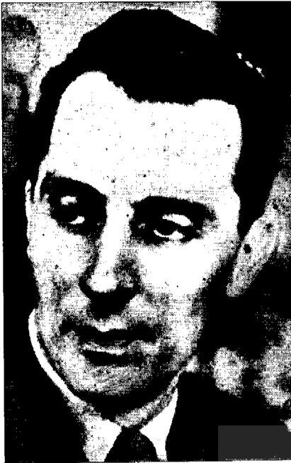
• ژلیو کوری