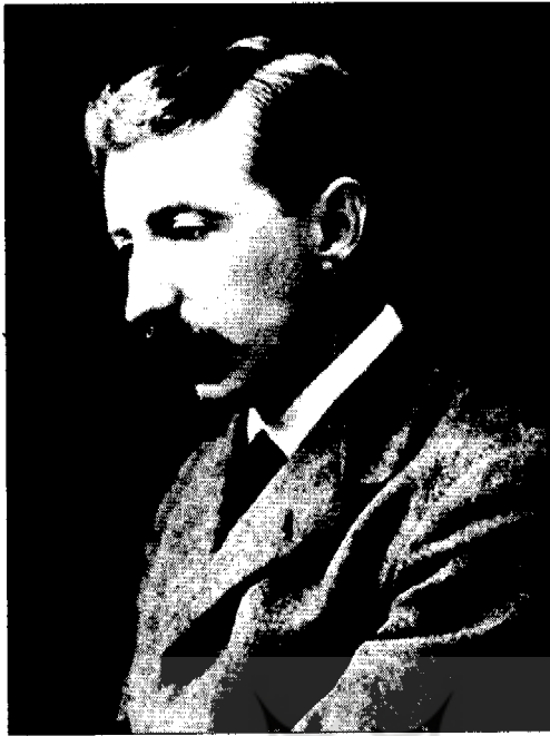
• بی.ام. فارستر

است سرشار از پژواکها و یادآوریهای ظریف و زیبا و توازیها و تشابهات هوشمندانه‌ای که خواننده دقیق از آنها لذت می‌برد و در پایان، ولی نه پیش از پایان، متوجه می‌شود که همه آن پژواکها و توازیها، گویی در کلیسای جامع کوه پیکری روی داده است، و کتابی که وقتی خوانده می‌شد آنقدر به نظر می‌رسید از شاخ به شاخ می‌پرد، براستی دارای وحدت طرح و شکلی از پیش مقدر است.