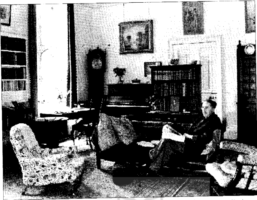
• بی. ام. فارستر در میانسالی

هست؛ این همان شخص است، و دختر به ظاهر بد نام او، به پیروی از وظیفهٔ فرزندی، کار پدر را رونویسی کرده و انتشار داده است. فطرت او نیز مانند بیشتر فطرتها در پروست، جنبه‌های بسیار دارد.