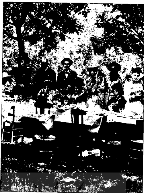
• مارسل پروست (با کلاه حصیری) در مراسم نهار در ییلاق.

یکی از شواهد این امر، «جمله کوچک» ( la petite phrase ) معروفی است که در موسیقی مردی به نام وِنتوی (۱) به گوش می‌رسد و خود تقریباً به یکی از بازیگران بدل می‌شود، منتها بازیگری که دائماً در نقشی جدید به صحنه می‌آید. نام وِنتوی نخستین بار در اوضاع و احوالی وحشت انگیز شنیده می‌شود. او ارگ نوازی حقیر و گمنام در شهری کوچک بوده که اکنون مرده است و دخترش نام او را به ننگ می‌آلاید. صحنه وحشتناک مورد نظر - مانند هر چیز دیگری در پروست - از هر طرف دارای تبعاتی می‌شود. مدتها بعد، سوناتای برای ویولون در پاریس به اجرا در می‌آید، و در موومان آهسته آن، جمله کوچک توجه یکی از اشخاص رمان موسوم به سوان (۲) را جلب می‌کند و نرم نرمک به درون زندگی او می‌خزد. سوان عاشق دختری تهی مغز به نام اودت است و جمله کوچک ملازم عشق او می‌شود. ماجرای عشقی سوان - مانند بیشتر ماجراها در پروست - به درد سر می‌انجامد، و جمله کوچک از یاد می‌رود، اما مدتی بعد، هنگامی که سوان در آتش حسادت می‌سوزد، باز به گوش می‌رسد و این بار، ولی بدون از دست دادن سرشت آسمانی خود، هم با غم و اندوه سوان همعنان می‌شود و هم با شادیهای گذشته او. این سونات ویولون، ساخته کیست؟ وقتی سوان می‌شنود که ساخته وِنتوی است، می‌گوید: «عجب، زمانی من ارگ نواز بدبخت و بیچاره‌ای را به این اسم می‌شناختم. ولی این البته ممکن نیست همان شخص باشد.» ولی