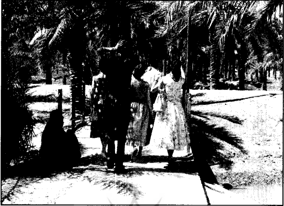
● کوچه نخلستانی به سمت کلپ قایق سواری آبادان، زن فقیر و جوانان ایرانی