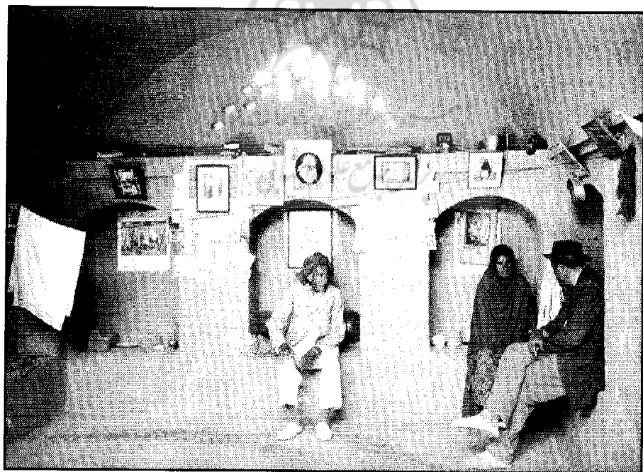
● نمای داخلی یک خانه زرتشتی