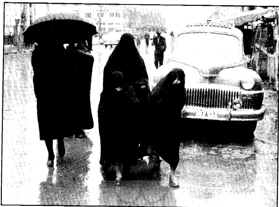
● نمایی از خیابان