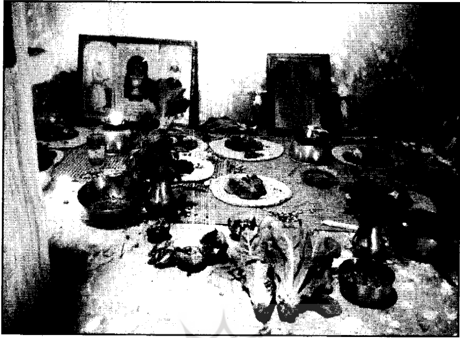
● خیرات معبد زرتشتیان یزد شامل کاهو، سبزیجات میوه و گل. در پس زمینه، تصویری از پیامبر زرتشتیان و یک ظرف نقره با آتش مقدس دیده می شود. در ظروف فلزی، خاکسترهای معطر است.