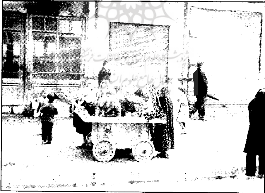
● بازدیدکنندگان از کارخانه پبسی کولا