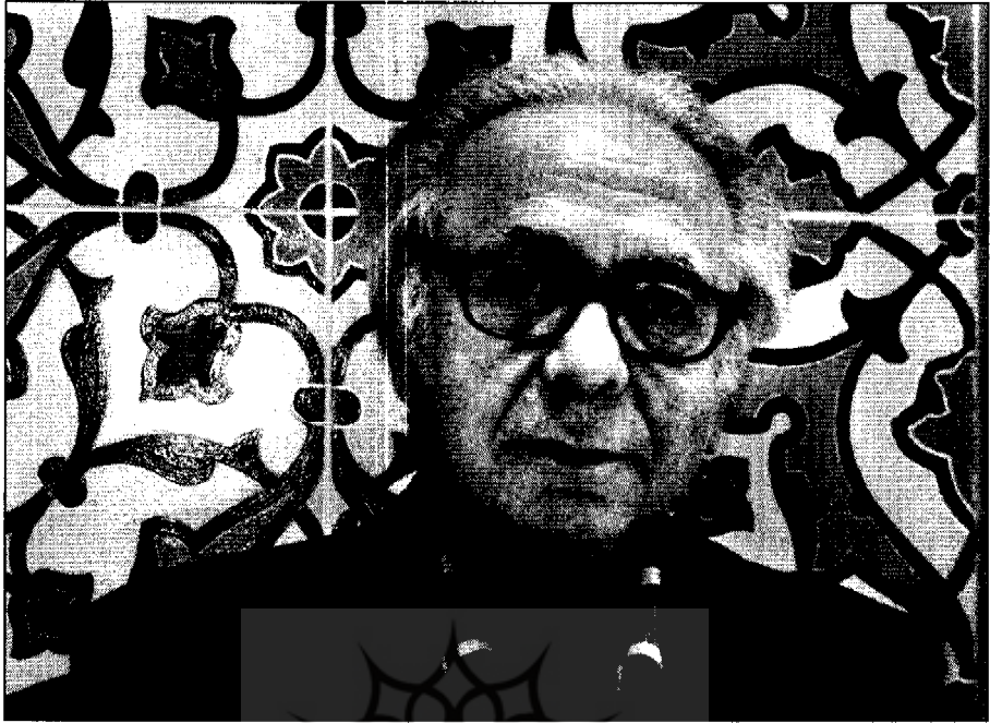
● دکتر جلال خالقی مطلق

در شناخت شاهنامه و فردوسی آغاز شد و در طی این سال‌ها کتاب‌ها و مقالات متعددی از سوی محققان و استادان ادب فارسی و شاهنامه‌شناسان منتشر شده است. اما هنوز ابهام‌ها و نکته‌های بسیاری درباره شاهنامه و فردوسی مانده است که باید گفته و نوشته شود. از میان گروه استادان و شاهنامه‌شناسان در دوران معاصر دکتر جلال خالقی مطلق جایگاه ویژه‌ای دارد. نام دکتر خالقی با شاهنامه و فردوسی پیوند خورده است. او متجاوز از چهار دهه است که عمر و زندگی خود را بر سر تصحیح متن تازه‌ای از شاهنامه نهاده است.