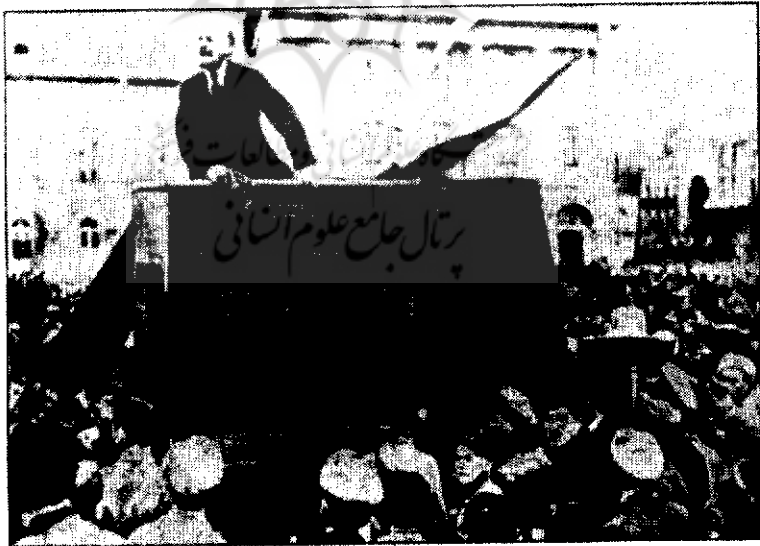
● همان صحنه، همان تاریخ، به دستور استالین، تصویرهای تروتسکی و کامنف در فیلم رتوش و حذف می‌شوند.