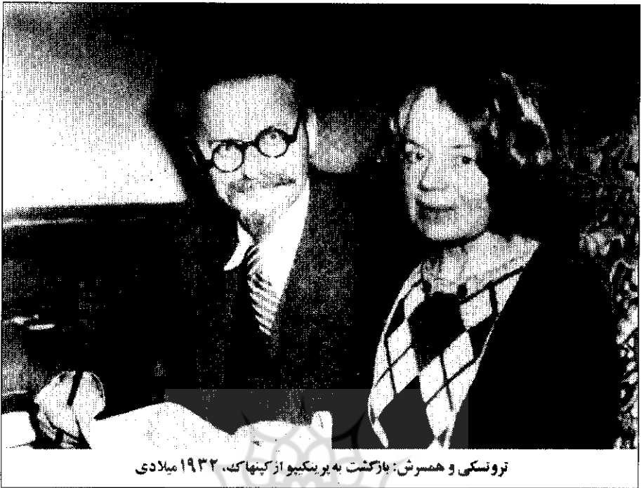
تروتسکی و همسرش: بازگشت به برنیکپو از کپنهاک، ۱۹۳۲ میلادی