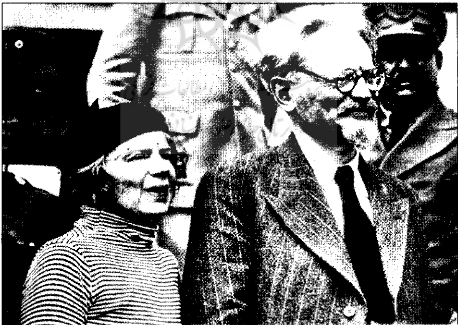
● تروتسکی و نانالیا (همسرش) هنگام ورود به مکزیک، ۱۹۳۷ میلادی

● تروتسکی و همسرش در بازگشت بر برنیکپو از کپنهاک، ۱۹۳۲ میلادی