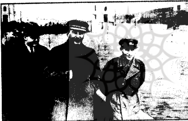
قبل از دسامبر ۱۹۳۸. از چپ به راست: وروشیلوف، مولوتوف، استالین و یزوف هنگام بازدید از آب راه مسکو-ولگا