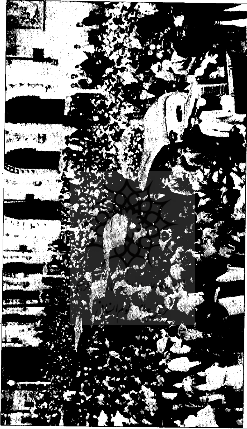
۱۹۴۰، ماه اوت، مکزیکوسیتی، تشییع جنازه تروتسکی.