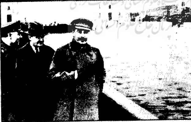
بعد از دسامبر ۱۹۳۸. یزوف سقوط می‌کند. استالین دستور می‌دهد که یزوف از عکس حذف شود.