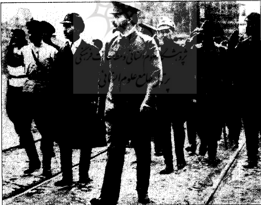
● نروتسکی پس از جنگ کبیر میهنی در مسکو از سپاه بازدید می‌کند