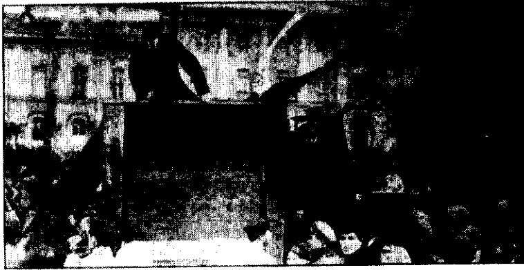
● ۱۹۲۰. پنجم مه، میدان سفردولف، لنین مشغول سخنرانی است، تروتسکی و کامنف در سمت راست تصویر، دیده می‌شوند.