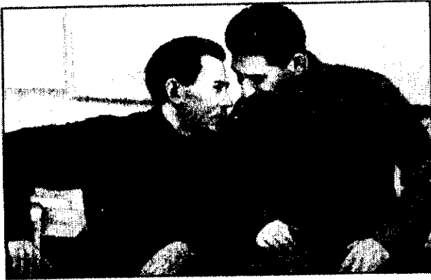
استالین و یزوف دوستان صمیمی