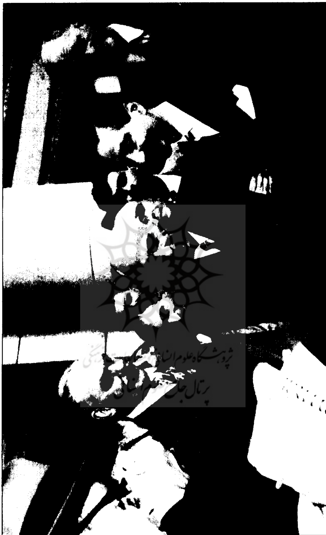
● در ورودی سازمان ملل - انتظام زیر بغل دکتر مصدق را گرفته و دین آچمن وزیر خارجه آمریکا و خبرنگاران دیده می شود.