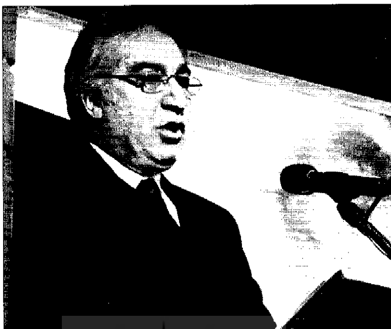
● مجید خسرو شاهین

در مورد جراحی قلب و مراقبتهای بعد از عمل تکنیکهای جدیدی را ابداع نمود که برای بهبود مریضها حائز اهمیت زیادی بود، مثلاً در جراحی پیوند قلبی که تلفات بعد از عمل در بهترین مراکز قلبی دنیا بین ۱۰ - ۸٪ بود در بخش جراحی قلب ایشان فقط به ۳/۷٪ می‌رسید. پروفیسور صادقی تاکنون بیش از ۳۰۰ مقاله علمی - پزشکی در نشریات معتبر دنیا به چاپ رسانیده است که محصول سالیان طولانی تدریس و تحقیق در دانشگاه لوزان سوئیس می‌باشد. ایشان پس از بازنشستگی بیشتر به کارهای ادبی پرداخت و بواسطه موانست دیرین با ادب فارسی اقدام به ترجمه رباعیات حکیم عمر خیام به زبانهای انگلیسی و فرانسوی نمود که با تلاش ایشان اثر ارزشمندی مشتمل بر ۱۱۰ رباعی منسوب به حکیم نیشابوری با خط جمیل استاد امیر خانی و تابلوهای زیبای استاد محمود فرشچیان به طبع رسید.