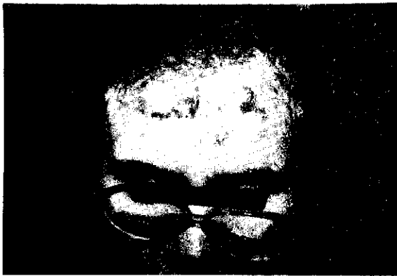
شکل ۳- کندن موها

* در برخی از آزمودنیهای بیش از یک نقطه از بدنشان آسیب دیده بود.