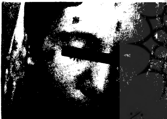
شکل ۴- کندن پوست صورت

آنها برای حل مشکل خود به پزشکی قانونی فرستاده شود. این بررسی تفاوت در شیوع خودآزاری در زن و مرد را معنی دار نشان نداد. بررسیهای انجام شده توسط فابیش (۱) شیوع بیشتر خودآزاری هدفمند را در زنان نشان می‌دهد (سندون و سندون، ۱۹۷۵). شاید استقلال بیشتر زنان و حضور بیشتر آنان در اجتماع را بتوان دلیل مراجعه بیشتر آنها به پزشکی قانونی دانست و یا دست کم برابر بودن اهمیت مراجعه زن و مرد را به این سازمان در جوامع غربی نسبت داد. بزرگسالان در جوانی بیشتر خودآزاری می‌کنند تا در سنین کودکی و پیری. داشتن اطلاعات کم و ناکافی از مسائل پزشکی و تحصیلات متوسطه عوامل مؤثری در افزایش شیوع به خودآزاری شناخته شده‌اند. در بررسی