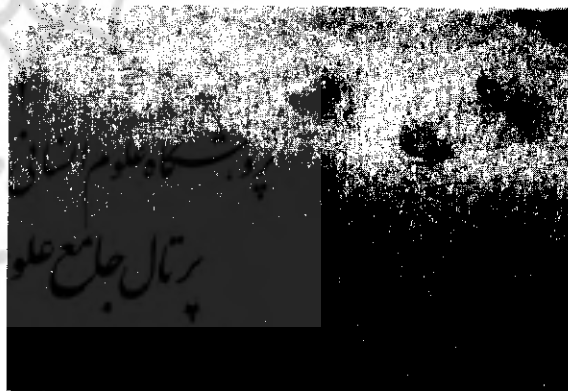
شکل ۱- خودآزاری با ناخن (کندن پوست)

آنها برای حل مشکل خود به پزشکی قانونی فرستاده شود. این بررسی تفاوت در شیوع خودآزاری در زن و مرد را معنی دار نشان نداد. بررسیهای انجام شده توسط فابیش (۱) شیوع بیشتر خودآزاری هدفمند را در زنان نشان می‌دهد (سندون و سندون، ۱۹۷۵). شاید استقلال بیشتر زنان و حضور بیشتر آنان در اجتماع را بتوان دلیل مراجعه بیشتر آنها به پزشکی قانونی دانست و یا دست کم برابر بودن اهمیت مراجعه زن و مرد را به این سازمان در جوامع غربی نسبت داد. بزرگسالان در جوانی بیشتر خودآزاری می‌کنند تا در سنین کودکی و پیری. داشتن اطلاعات کم و ناکافی از مسائل پزشکی و تحصیلات متوسطه عوامل مؤثری در افزایش شیوع به خودآزاری شناخته شده‌اند. در بررسی