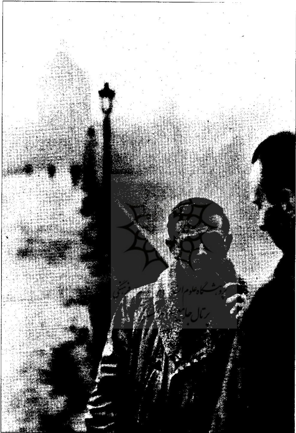
● زن پل سارتر (۱۹۴۶)