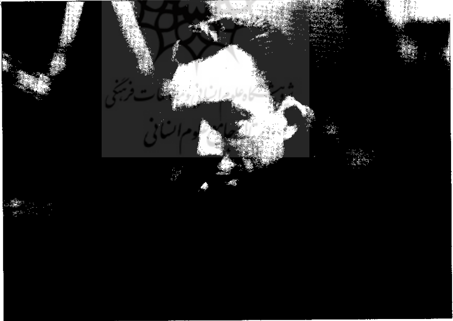
● آلبیر کاتبو (۱۹۴۴)