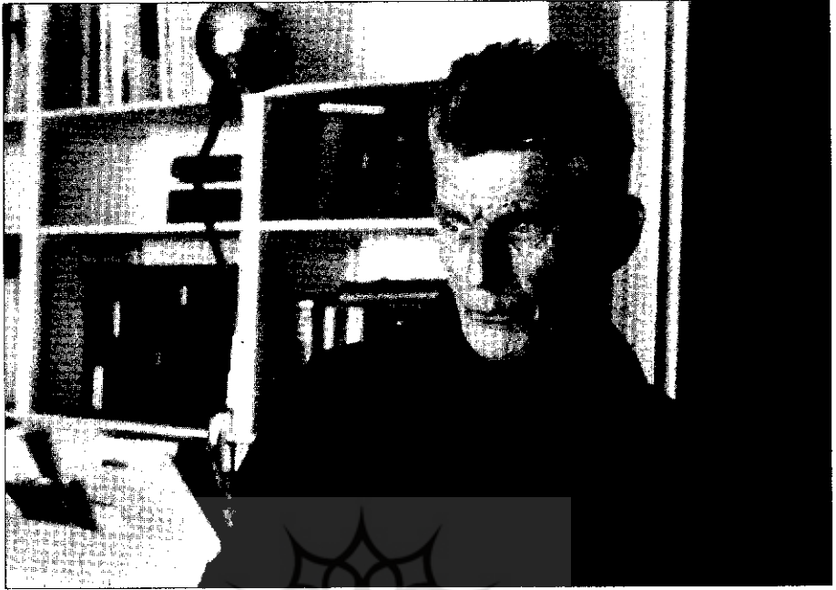
● ساموئل بکت (۱۹۶۵)