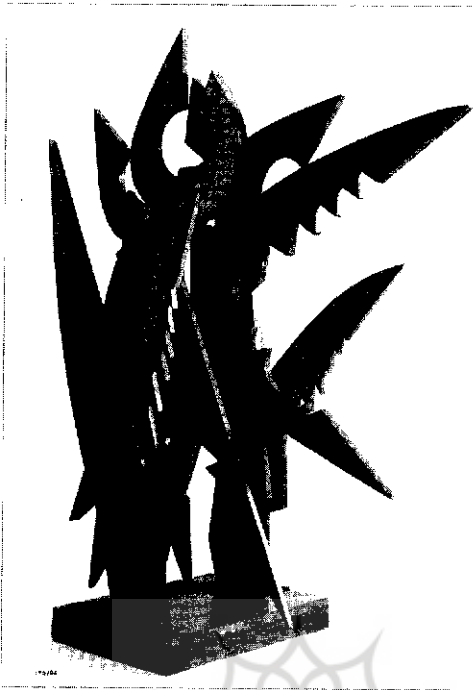
گیر و دار (مجسمه مفصلی)، ۱۳۵۲، چوب ۱۵ قطعه از مجموعه موزه هنرهای معاصر تهران

روشهای بازنمایی طبیعت گرایانه وجود ندارد. حصول این بیان از راههای شهودی و عقلانی امکانپذیر است. به قول کاندینسکی، در خلق یک اثر انتزاعی عقل، خودآگاهی و اراده نقشی قاطع ایفا می‌کنند. اما آنچه از محاسبه برون می‌آید فقط احساس است و زبری در همسویی با جریانهای انتزاع هندسی (کنستروکتیویسم) و انتزاع تغزلی (اکسپرسیونیسم انتزاعی)، و با بهره‌گیری از آموزه‌های نمایندگان برجسته این جریانها توانسته است روشهای محاسبه و بداهه را در دوره‌های مختلف کارش با موفقیت بیازماید. آنگاه که پنجه بر ماسه می‌کشد و یا وقتی که قطعات چوب و فلز را با دقت به هم می‌چسباند، یکی از این دو جنبه هنر او نمایان‌تر می‌شود. اما تجربه‌های مختلف وزیری همواره معطوف به بیانی است از واقعیت دنیای درون - دنیایی که هیچگاه آرام نمی‌گیرد. وزیری در خلال دو دهه اخیر، شمار زیادی نقاشی و تکه چسبانی انتزاعی در ابعاد نسبتاً کوچک پدید آورده است که به لحاظ شیوه و اسلوب کار بسیار متنوع‌اند. این مجموعه را می‌توان مرور بر تجربه‌های قبلی و یا تکاپو برای یافتن راه جدید تلقی کرد. گویی او در سفری به گذشته از منزلگاه‌های نقاشی شنی، نقشبرجسته فلزی، مجسمه مفصلی و مجموعه «هراس و پرواز» می‌گذرد تا زوایای دیگری از قلمرو خود را بکاود و چیز تازه‌ای کشف کند. وزیری در این آثار نیز همچون گذشته، رفتارهای شهودی و عقلانی خود را به نمایش می‌گذارد. گاه با خط‌ها و رنگها بدیهه‌نگاری می‌کند و گاه ساختارهای دقیق از شکلهای رنگی می‌آفریند، و