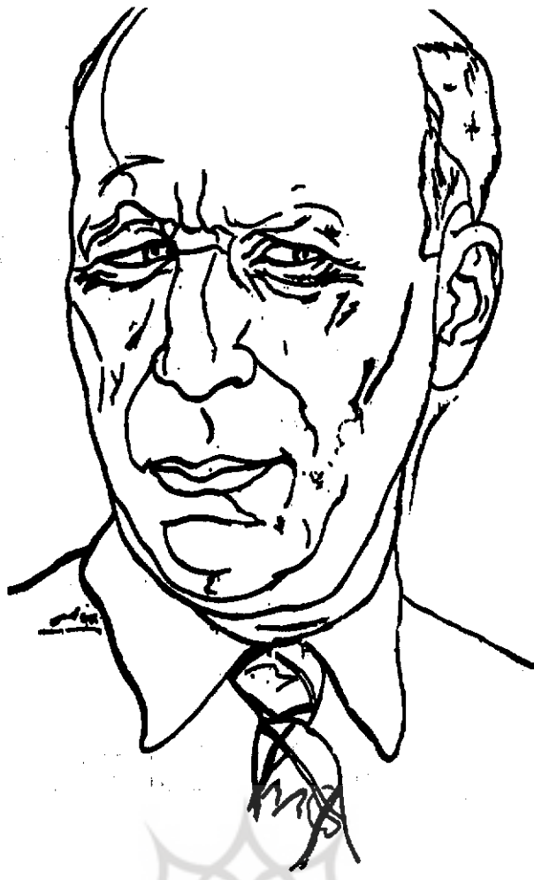
● طراحی از چهره خلیل ملکی کار بهمن محصن

هم نرفت. بعد از آنکه ماجرای فرقه دمکرات آذربایجان به راه افتاد و حزب توده، علی رغم مخالفت جمع کثیری از اعضایش، کمیته ایالتی حزب را در آذربایجان منحل کرد و به فرقه دمکرات تحویل داد، یعنی عملاً بر تجزیه ایران صحنه گذاشت، و بخصوص بعد از آنکه حزب در تهران هم آشکارا به حمایت از سیاست شوروی برخاست و تحت حمایت سربازان ارتش سرخ میتینگ داد و از واگذاری نفت شمال به روس‌ها طرفداری کرد، اختلافهای درونی حزب توده ترمیم‌ناپذیر شد. جزئیات ماجراهای آن سالها را باید در کتابها خواند. خلاصه آنکه، ملکی همراه با بسیاری از فعالان و سرشناسان حزب توده انشعاب کرد. در جریان انشعاب، انور خامه‌ای نقشی فعال داشت؛ ظاهراً پیشنهاد انشعاب اصلاً از جانب او مطرح شد. * سپس، ملکی خانه‌نشین شد و از سیاست کناره گرفت. اما وقتی امواج نهضت ملی شدن نفت به رهبری دکتر محمد مصدق فوران گرفت، ملکی هم به عرصه مبارزات سیاسی بازگشت. او را با دکتر مظفر بقایی، که در آن زمان از فعالترین حامیان مصدق بود، آشنا کردند و آن دو «حزب زحمتکشان ملت ایران» را پایه گذاشتند. این حزب مدت کوتاهی خوش درخشید. در واقع، به تعبیری، به صورت نهاد تثوریک نهضت ملی درآمد. در آن شرایط که روزنامه‌های حزب توده غوغا