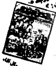
خاموشی گل آقا پس از ۱۷ سال

هفته نامه «گل آقا» با انتشار آخرین شماره، ۱۷ ساله خود در زمینه طنز پایان داد. «گویی ضرورتاً مسئول روابط عمومی مطلب به این راه گشت: دلایل شخص